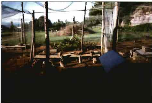
En el interior de los parques se disponen elementos estáticos para que los gazapos puedan ejercitar el instinto de esconderse.