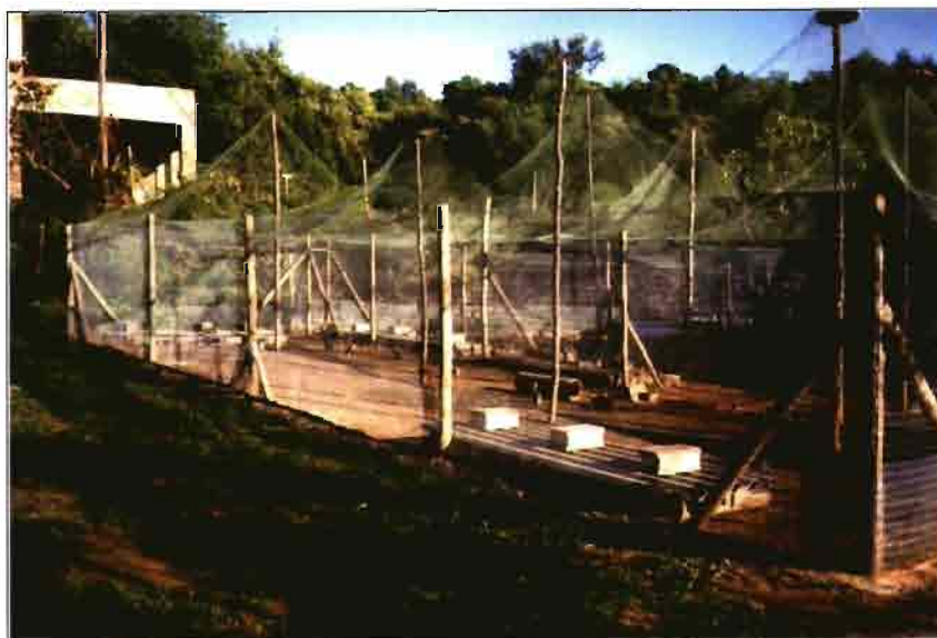
Vista general de una de las áreas de semilibertad. Obsérvese la rusticidad del cercado, bordeado de hormigón para evitar huidas y la cubierta zenital de malla para evitar las aves rapaces.

Esta área es muy importante, y se estima necesita de 0,2 a 0,4 m 2 por animal. Los cercados se realizan general-