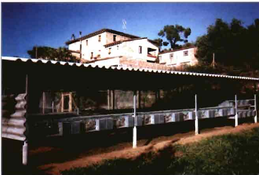
Detalle de una de las unidades de madres. Como se puede apreciar, se trata de instalaciones bajo cubierto totalmente simples.