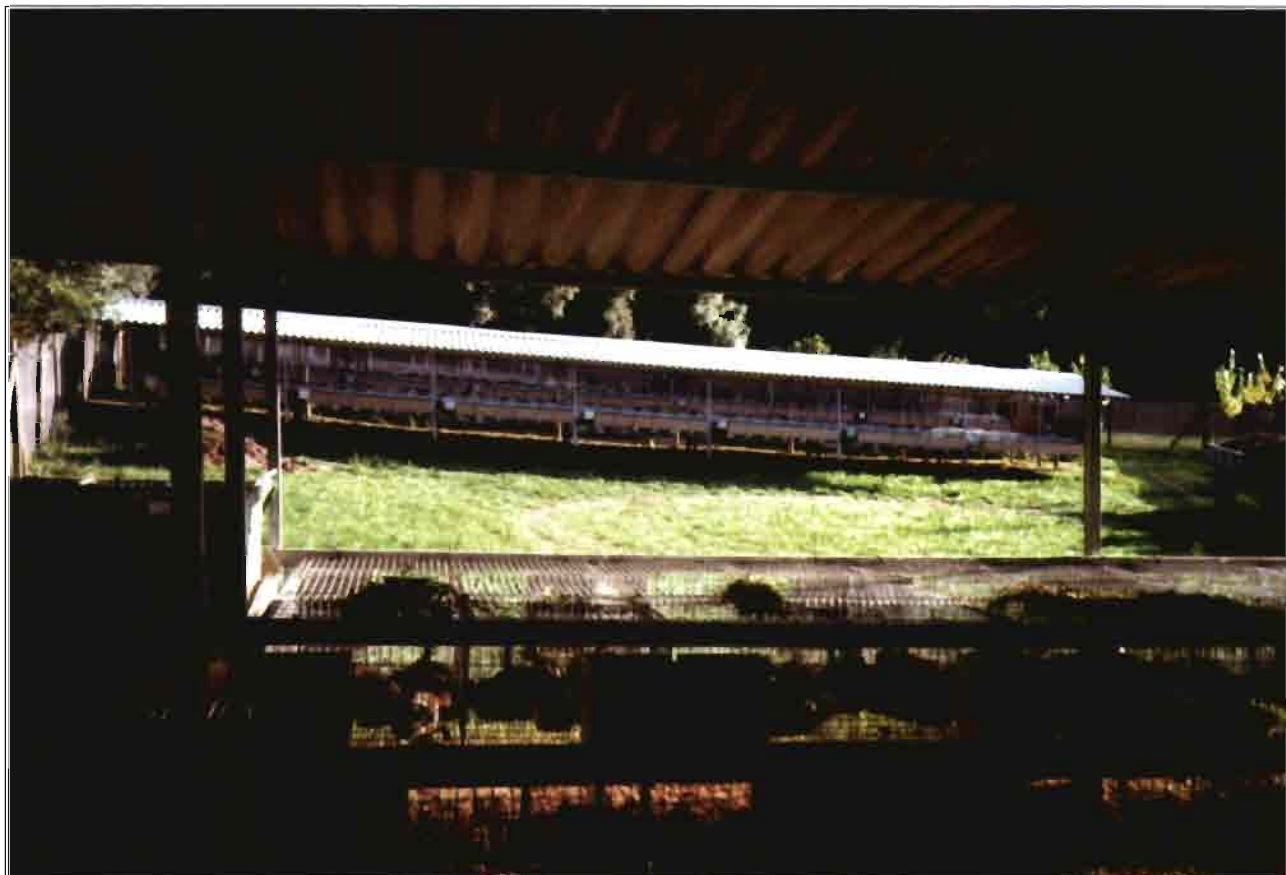
Detalle del post-destete. Los gazapos permanecen aquí unas dos semanas después de separarse de las madres. Más adelante son soltados a los parques para adaptarse a la vida silvestre.

El renuevo de reproductores se debe escoger cuidadosamente, en cuyo caso las futuras madres se dejarán en la jaula más tiempo, con una densidad de 20 a 25 recrias por m 2 , o sea de 7 a 9 por jaula.