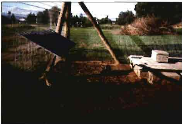
Detalle de un ángulo del área de semilibertad. Unas placas de plancha protegen el rastrillo-verdulero de la lluvia.

Es conveniente disponer de un cubierto para almacenar pienso, paja, forrajes, productos zoonosanitarios, etc. Esta zona se puede usar asimismo como zona de expedición. Pensamos en un cerramiento a 3 vientos, construido en bloques de hormigón, estructura metálica y cubierta de fibrocemento. Se incluirán lógicamente instalaciones de agua y luz. Optativamente puede acondicionarse un espacio, aislado el techo y colocando paramentos verticales, como despacho. Esto supone incrementar el precio unas 75.000 ptas.