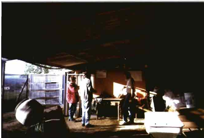
Un edificio destinado a servicios hace a la vez las funciones de almacén, zona de expedición y oficina.

Al llegar a la pubertad, o sea a la edad de tres meses, se separan y sitúan en jaulas individuales de reposición.