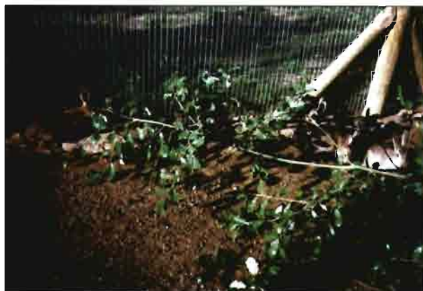
Detalle de la introducción de ramas de árboles en el área de aclimatación, para que los animales se habituen al ramoneo.