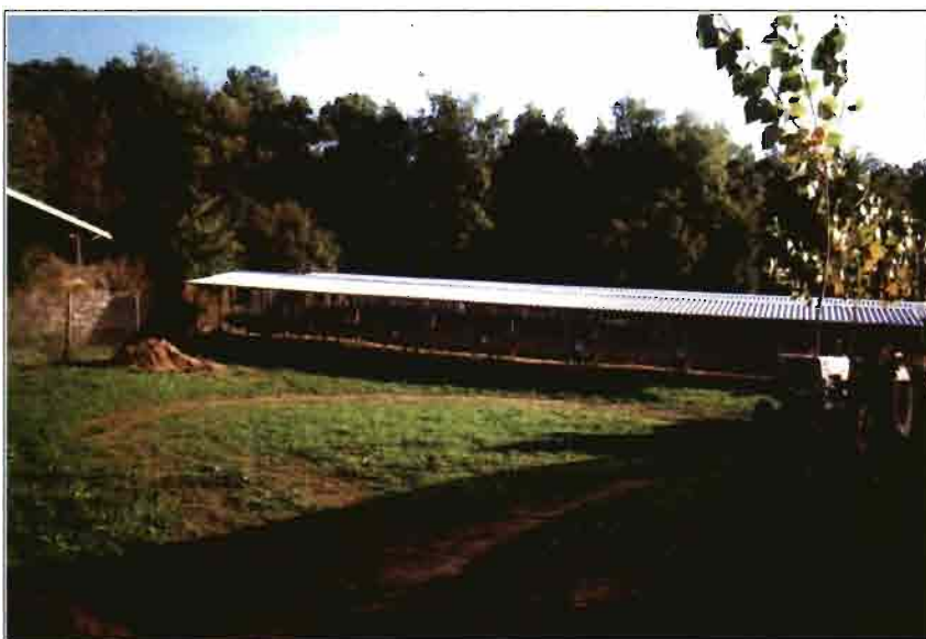
Vista general de las unidades de maternidad situadas paralelas y en una zona abrigada del bosque. Instalación al aire libre totalmente cercada.

Nave destinada al post-destete y recria. La instalación es muy similar a la de maternidad, variando el tipo de jaulas. La recria de reproductoras con más de 90 días se realiza en celdas individuales. Los machos se separan desde el inicio.